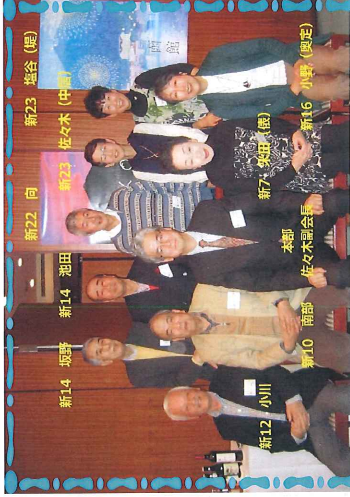
函商同窓会 名古屋支部総会 平成25年11月10日(日)

周年に向けて準備が始まった。わくわくするような会にしたい。この会も箱を開けると、母校の活躍を伝え